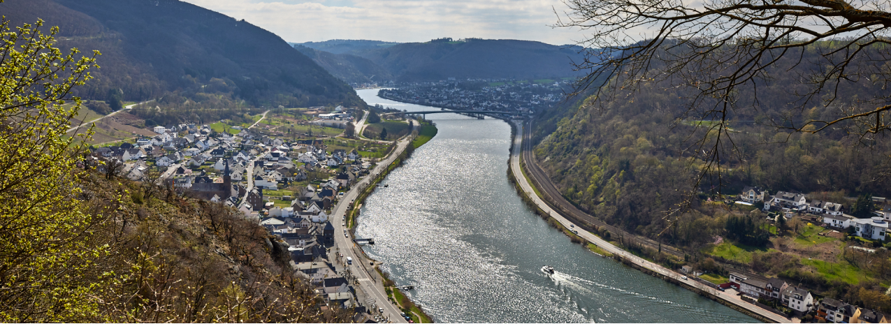
Blick auf die Mosel vom Bleidenberg