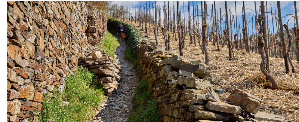
Natursteinmauern in den Weinbergen bei Oberfell.

wieder aufsteigen) müssen. Aber es war von vornherein klar, die Tour ist sportlich, also ab nach Oberfell. Auf dem Abstieg kommen wir noch an ein paar Skulpturen vorbei, dann erreichen wir auch schon Oberfell.